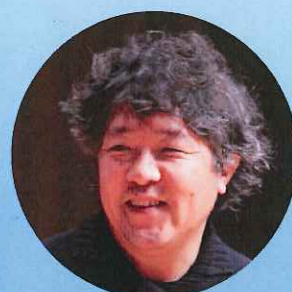
茂木 健一郎 氏 (もぎ・けんいちろう) 脳科学者